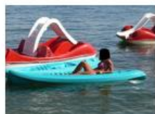
Daska za jedrenje, sandolina, pedalina i sl.