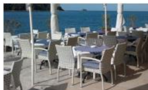
Pripadajuća terasa objekta - m 2