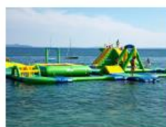
Agua park i drugi morski sadržaji