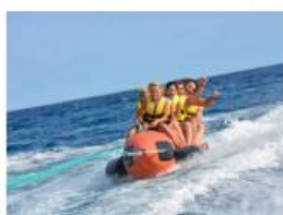
Sredstvo za vuču s opremom