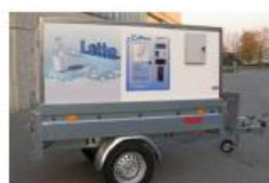
Ambulantna prodaja (škrinja, aparati za sladoled i sl.)