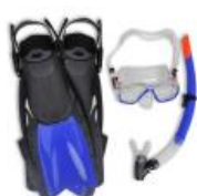
Pribor i oprema za ronjenje, kupanje i sl.