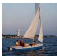
Jedrilica, brodica na vesla