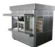
Kiosk, prikolice montažni objekti do 12 m 2