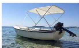
Brodica na motorni pogon