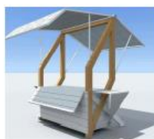
Štand (rukotvorine, igračke, suveniri i sl.)