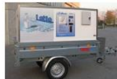
Ambulantna prodaja (škrinja, aparati za sladoled i sl.)