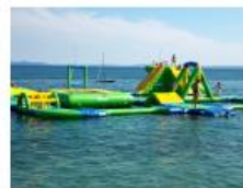
Agua park i drugi morski sadržaji