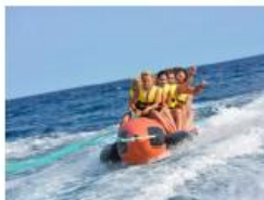
Sredstvo za vuču s opremom