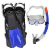
Pribor i oprema za ronjenje, kupanje i sl.