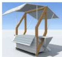
Štand (rukotvorine, igračke, suvenir i sl.)