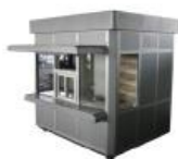
Kiosk, prikolice montažni objekti do 12 m 2