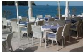
Pripadajuća terasa objekta - m 2