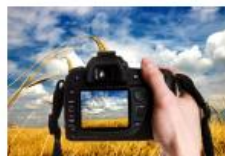
Slikanje i fotografiranje