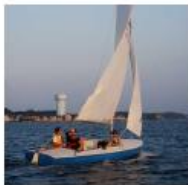
Jedrilica, brodica na vesla