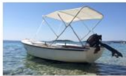
Brodica na motorni pogon