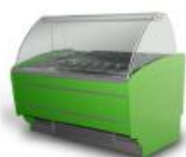
Ambulantna prodaja: škrinja za sladolede