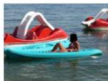
Daska za jedrenje, sandolina, pedalina i sl.