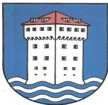
Slika Grb i zastava Općine Marina

Prema statutu Općine Marina kojim se uređuje samoupravni djelokrug, njegova obilježja, javna priznanja, ustrojstvo, ovlasti i način rada tijela, Općina Marina je osnovana po Zakonu o područjima županija, gradova i općina u Republici Hrvatskoj („Narodne novine „ br. 90/92).